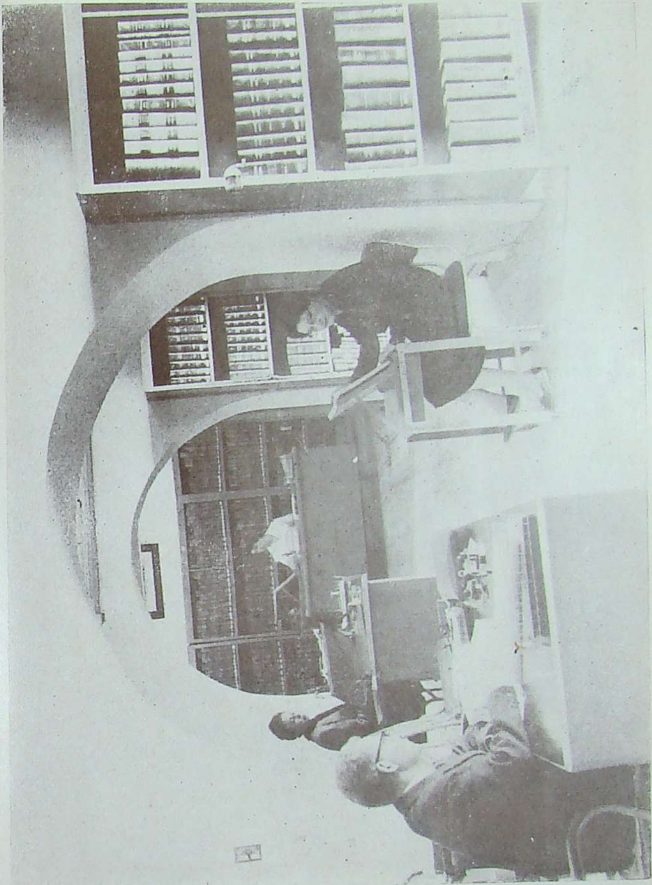
Salones del Fondo Histórico del Museo