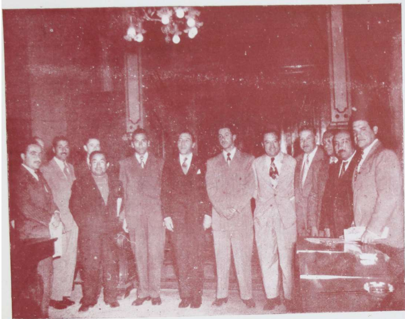
El Sr. Alcalde con los personeros del Deporte Capitalino y los cronistas deportivos de los principales diarios