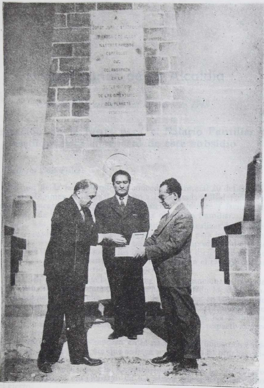
Tierra de la Línea Equinoccial que se remitirá a España.