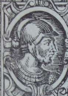
Diego de Almagro