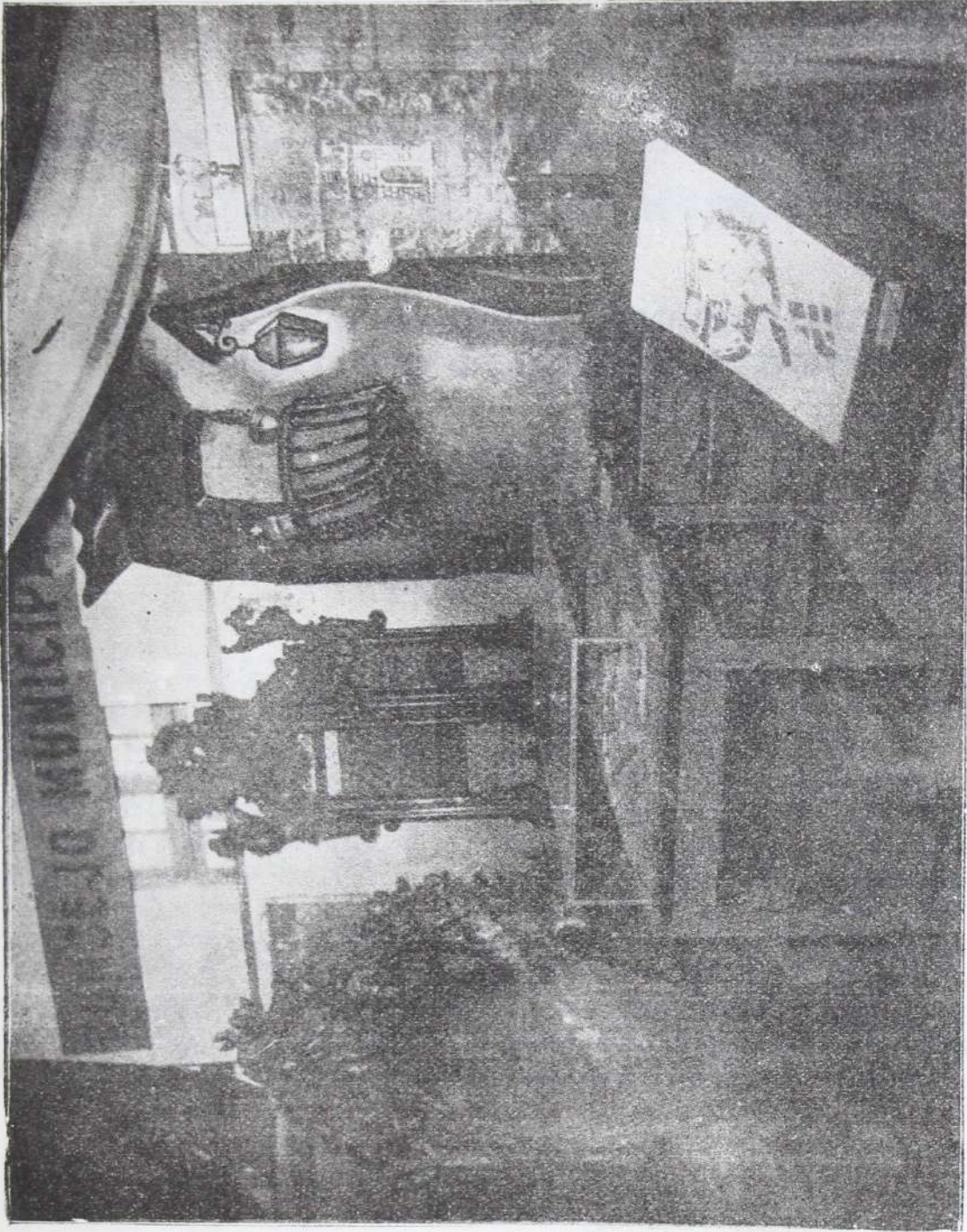
Local Municipal en la Feria Nacional de Muestras.