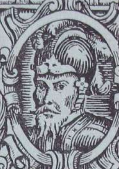
Sebastian de Benalcázar