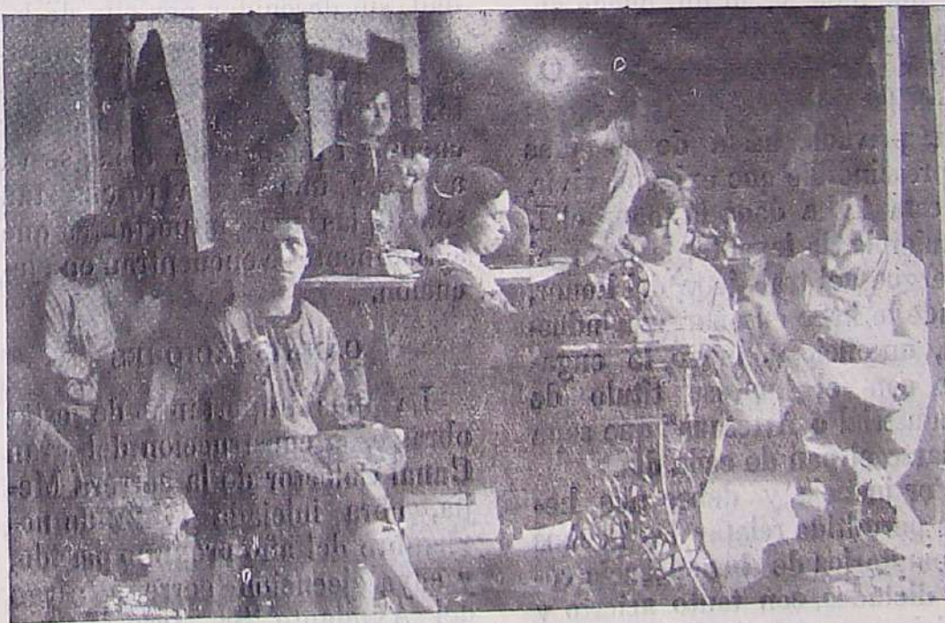
Alumnas de la clase de costura, en su propio departamento, recibiendo lección del Director y de la Profesora.