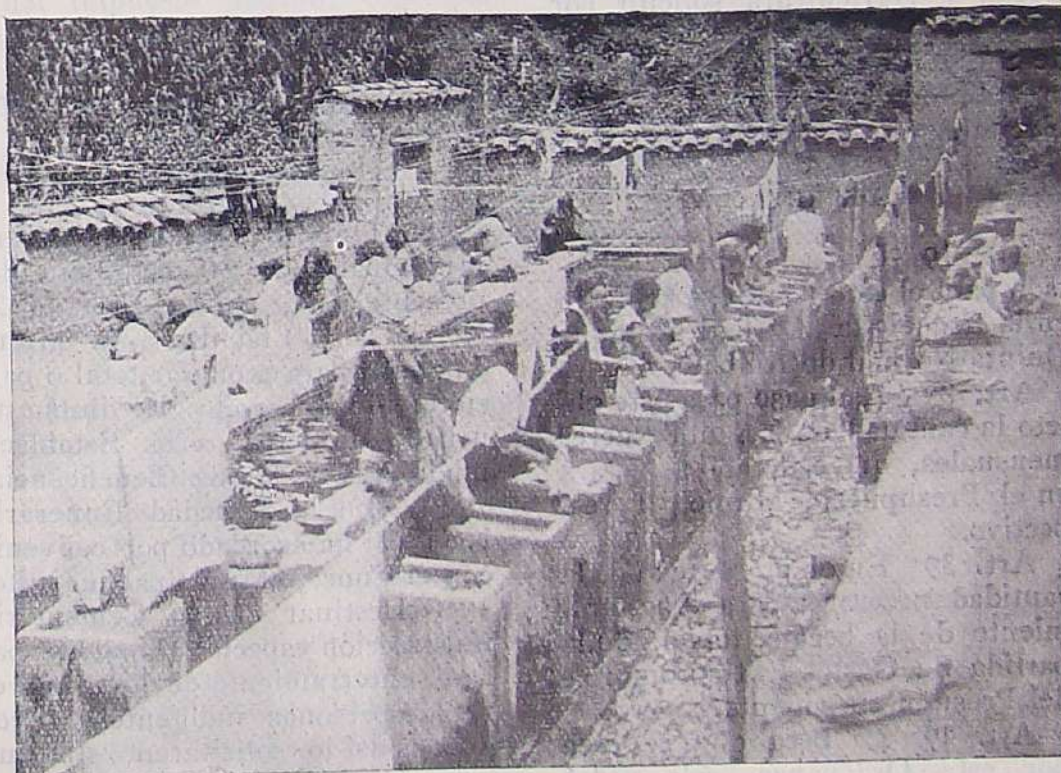
Las ilustraciones I y II representan las lavanderías y los estanques con los baños contiguos de "Los Milagros". Tanto las lavanderías como los baños fueron adquiridos por el Concejo Municipal el 4 de Agosto de 1926, para destinarlos, como se encuentran actualmente, al uso gratuito del pueblo de Quito. Su costo incluso las mejoras, es de $ 15.745.