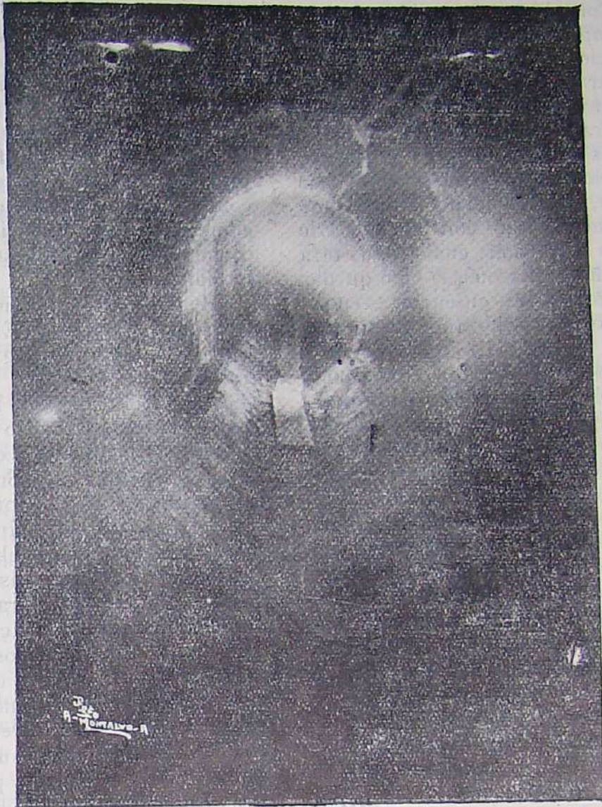
Vista de una parte del Gran Colector de la Carrera Mejía, entre Cotopáxi y Yerovi (tras la muralla de la Merced); sección que aún no está revestida con concreto. Obra presupuestada en doscientos mil sueres.